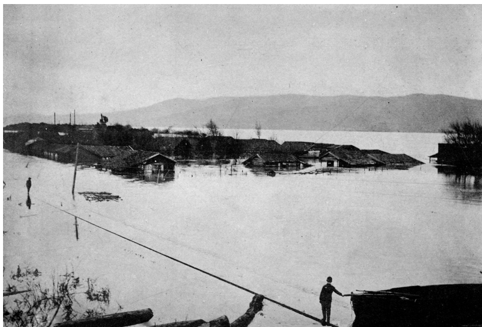
Figura 5. Inundación de fines de siglo XIX en Pedro de Valdivia.

Los individuos y los conjuntos óseos se encontraban, en términos generales, en un estado de conservación de Regular a Muy Malo, por lo que a pesar de que el tratamiento de recuperación privilegió el trato digno y respetuoso hacia los restos humanos, la fragilidad de los mismos resultó en una importante pérdida de material óseo, especialmente en vértebras, costillas y las epífisis de los huesos largos y un alto grado de fragmentación en todas las unidades óseas recuperadas. Así, la mayor información la hemos obtenido de la observación macroscópica de las diáfisis de los huesos largos y de las piezas dentales, que poseen los mejores grados de conservación, por lo que los diagnósticos que se presentan a continuación corresponden a apreciaciones poblacionales, toda vez que el análisis individual de los restos presenta vacíos, privilegiando aquellas características que nos parecen reflejan de mejor manera a los antiguos habitantes de la Misión San José de la Mocha durante su ocupación.