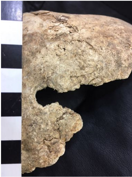
Figura 8. Cráneo con probable lesión por entrada de proyectil de arma de fuego

Skull with probable lesion by entrance of firearm projectile.