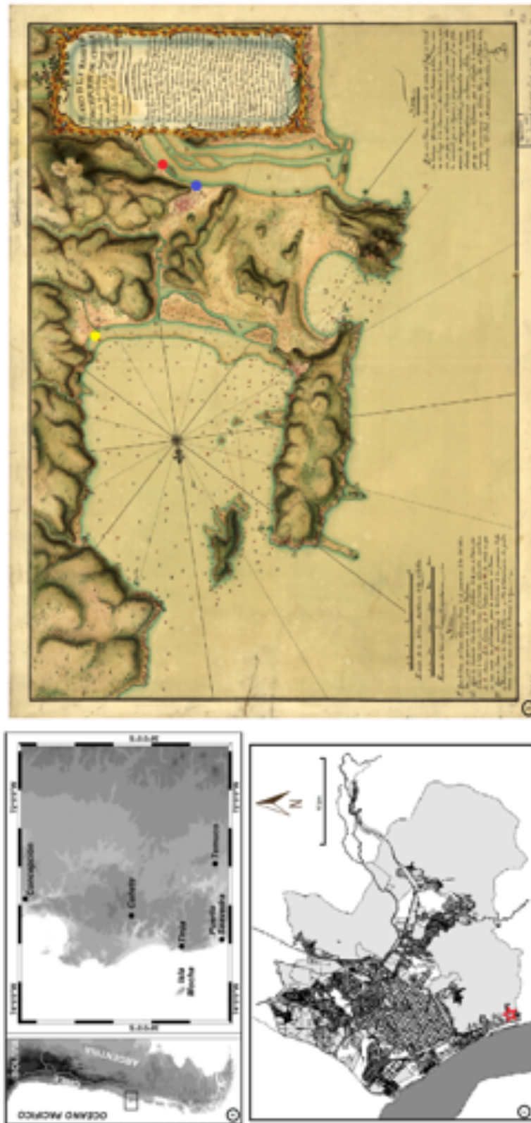
Figura 1. (a) Ubicación de isla Mocha en relación a centros urbanos del centro-sur de Chile (modificado de Campbell y Pfeiffer 2017); (b) Mapa de Ulloa y Moraleda (1782) donde se marcan las ubicaciones de Concepción antes (amarillo) y después del traslado (azul) y de la Misión San José de la Mocha (rojo); (c) Ubicación de la antigua Misión San José (en rojo) en la actual de la ciudad de Concepción (Ilustre Municipalidad de Concepción, 2018).

(a) Location of Mocha Island in relation to urban centers in South-Central Chile (Modified from Campbell and Pfeiffer 2017); (b) Map by Ulloa and Moraleda (1782) which highlights the locations of the settlement of Concepción before (yellow) and after the transfer (blue), and the area of the old San José de la Mocha Mission (red) within modern day Concepción (Concepción City Hall, 2018).