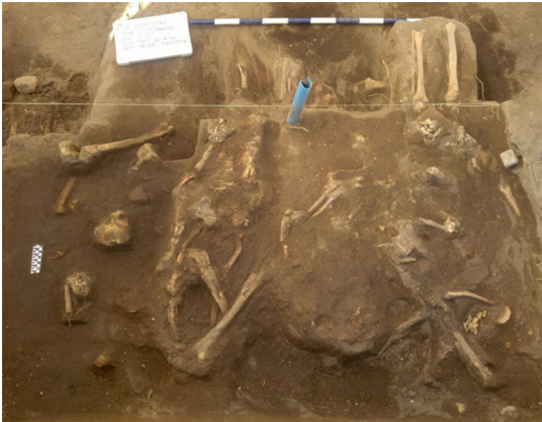
Figura 3. Vista general de uno de los conjuntos descubiertos. General view of one of the recovered bone assemblages.