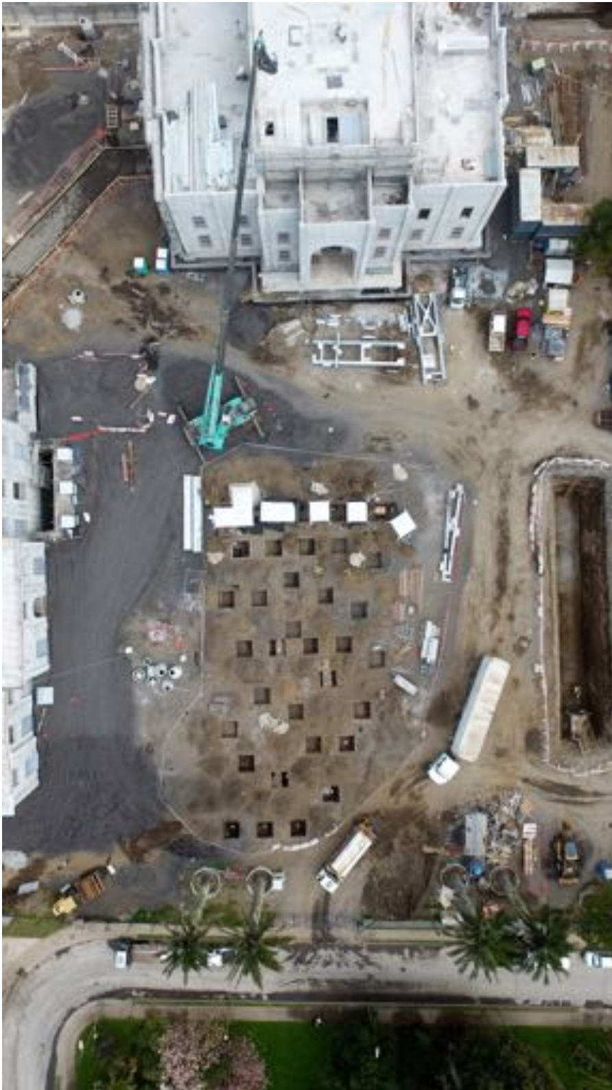
Figura 2. Área excavada en el sitio Quinta Junge. Excavated area in the site Quinta Junge.