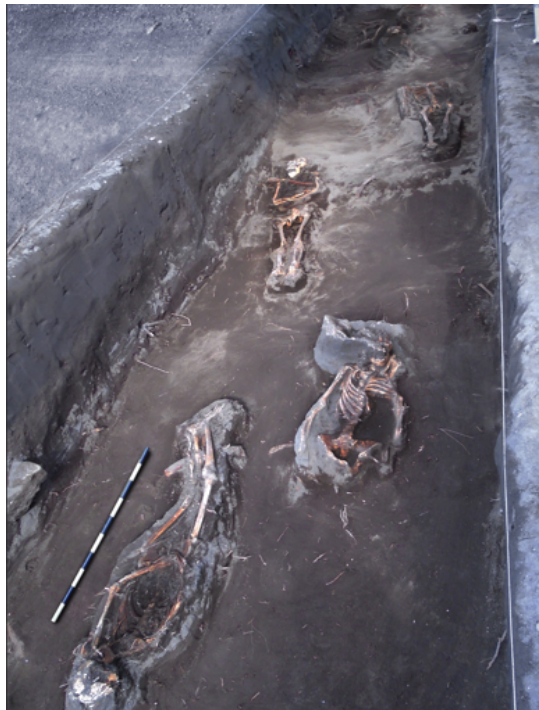
Figura 4. Área funeraria con algunos entierros in situ. Funerary area with some in situ burials.