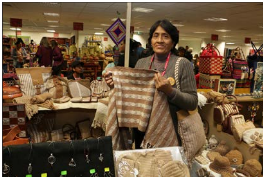
Figura 15. Artesanos del ecomuseo en la feria nacional Rurak Maki del Ministerio de Cultura.

Artisans of the ecomuseum in the Rurak Maki national fair of the Ministry of Culture.