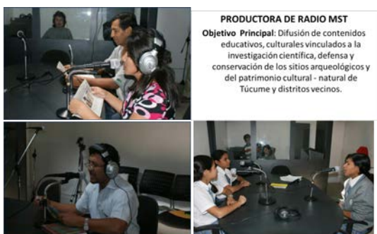
Figura 13. Productora radial del Museo Túcume.