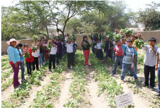
Figura 6. Cosechando los frutos de la tierra. Actividad del programa educativo del ecomuseo.

Harvesting the fruits of the land. Activity of the educational program of the museum.