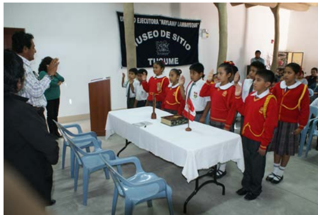
Figura 7. Directorio de niños del ecomuseo en ceremonia de compromiso.

Harvesting the fruits of the land. Activity of the educational program of the museum.