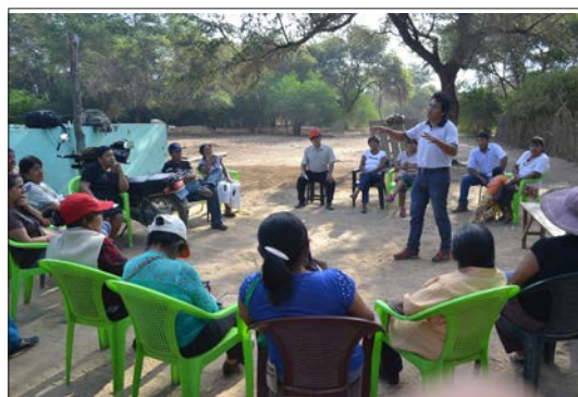
Figura 14. El ecomuseo en talleres de capacitación en caseríos rurales.

The ecomuseum in training workshops in rural hamlets.