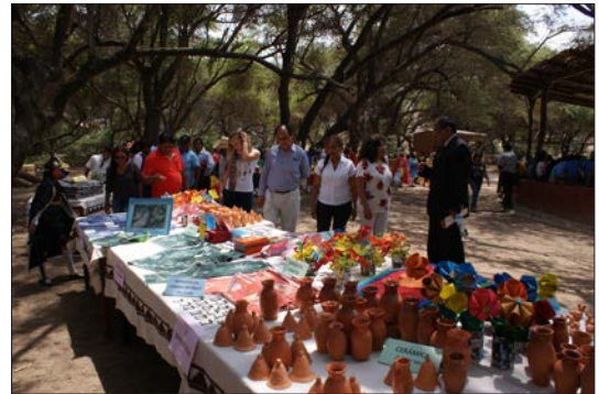
Figura 16. Feria de productos del programa educativo con las escuelas locales.

De este modo, las principales organizaciones de la comunidad hacen posible vincular un número cada vez mayor de personas con el patrimonio cultural y arqueológico, identificándose con él y adquiriendo motivaciones suficientes para protegerlo, más allá de