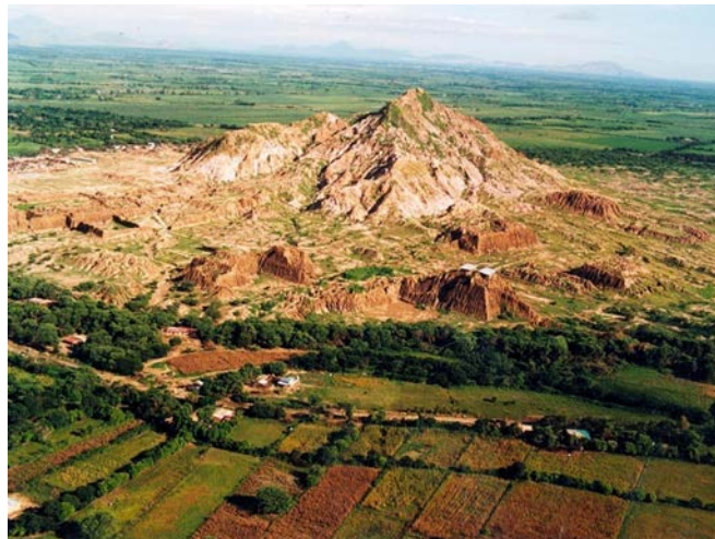
Figura 2. Pirámides de Túcume y Cerro Purgatorio con la ubicación del museo. Túcume pyramids and Purgatorio Hill with the location of the museum.

Location of Túcume in the Northern Coast of Peru. http://www.arqueologiadelperu.com.ar/tucume02.jpg Drawn by Lizardo Tavera Vega.