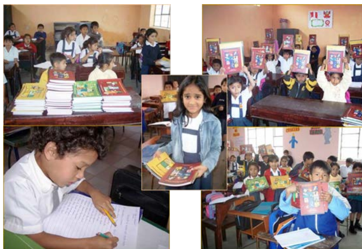
Figura 4. Distribución y uso de cuadernos interactivos en las escuelas.

Seguidamente, no dejamos pasar la oportunidad de articularnos en un gran proyecto con la Agencia Española de Cooperación Internacional, que permitió dar forma a los primeros productos, todos de muy alta calidad, dirigidos a la educación de los niños del nivel primario y luego secundario (Figuras 4 y 5). Con ello se hizo realidad una idea con la que nació el proyecto de museo, un esfuerzo para la gestión del conocimiento adquirido durante el proceso de investigación científica, realizado sobre la base de un amplio proceso de experimentación, de planificación participativa, de integración comunitaria y desarrollo educativo. Se abordaron temas con los que nos identificamos siempre, pero cuya comprensión alcanzó niveles importantes por lo aprendido en la Universidad de Kent, intercambiando ideas y propuestas con gestores de varias partes del mundo. Se publicaron tres cuadernos interactivos enfocados en los siguientes temas: tradiciones y costumbres, patrimonio natural y patrimonio arqueológico. Lo mismo se hizo para estudiantes de secundaria con dos productos complementarios: “Guías de Diseño” y “Guías de Proyectos”, uno por cada grado de estudio. Todos fueron el resultado de la participación de especialistas en pedagogía, de diseñadores gráficos