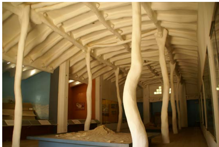
Figura 3. Sala principal del museo, 1994.

Derivado de este proceso, se estableció formalmente la Oficina de Educación para la Conservación y se