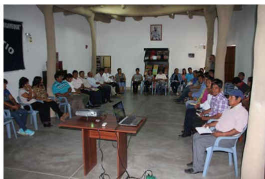
Figura 10. Sesión ordinaria del ecomuseo.

Members of the Túcume Ecomuseum on the day of its creation, in the auditorium.