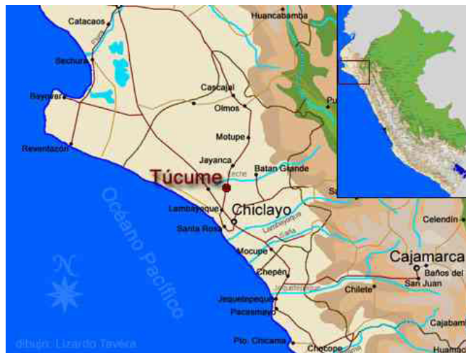
Figura 1. Localización de Túcume en la costa norte de Perú. Tomado de http://www.arqueologiadelperu.com.ar/tucume.htm . Dibujo de Lizardo Tavera Vega.

Location of Túcume in the Northern Coast of Peru. http://www.arqueologiadelperu.com.ar/tucume02.jpg Drawn by Lizardo Tavera Vega.