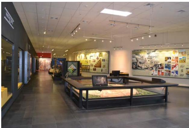
Figura 8. Interior de una de las salas del nuevo museo, 2014.

Board of children of the ecomuseum in commitment ceremony.