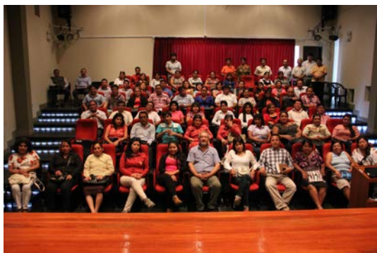
Figura 9. Integrantes del Ecomuseo Túcume el día de su creación, en el auditorio.

Members of the Túcume Ecomuseum on the day of its creation, in the auditorium.