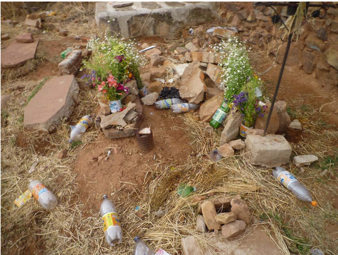
Figura 2. Tumbas con restos de celebraciones de varios años. Tombs with remains of celebrations of several years.

El caos que me encontré al llegar a la casa de don Pedro, justo después del almuerzo, resultaba