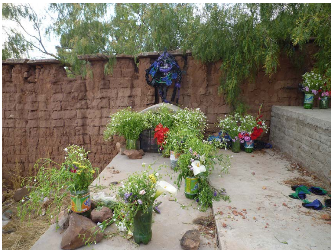
Figura 3. Una tumba decorada con flores modestas. A tomb decorated with modest flowers.

realmente complicado de gestionar y el ambiente era diametralmente opuesto al del día anterior en la celebración evangélica. Excepto las mujeres jóvenes y los niños, el resto se encontraba en estado de gran embriaguez. Había discusiones y conatos de pelea. Las mujeres mayores, ebrias, se abalanzaron sobre mí con la intención de que bebiera de las muchas botellas con alcohol que circulaban. Los pocos hombres que se encontraban más o menos sobrios me invitaron a sentarme junto al viudo y el padre de la difunta, a un costado del altar. Este ocupaba el lugar central del patio y aunque resulta complicado pensar que allí existiera un cierto orden, sí es cierto que a un costado del altar se encontraban los familiares directos de la difunta, al otro los hombres adultos; y en cierta forma, retiradas y cercanas a la puerta de salida, las mujeres jóvenes y los niños.