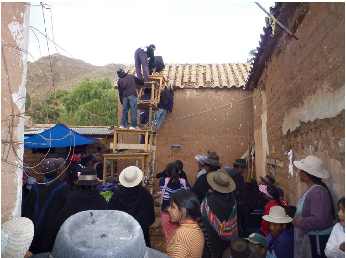
Figura 5. Desmontando la “tumba”. Taking apart “la tumba”.

Los invitados acuden siempre a la casa de la celebración con una o varias bolsas de plástico donde poder guardar los muchos panes con los que son obsequiados ese día 11 . En concreto hay dos tipos de panes que los asistentes nos llevamos