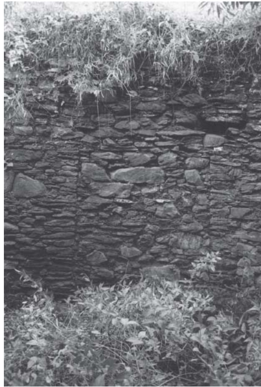
Figura 2. Muro norte de la kallanka de Maukallajta con ingreso bloqueado. Fotografía tomada desde el interior de la estructura. Northern wall of the kallanka of Maukallajta with blocked entrance. Photograph taken from inside the structure.

En el muro sur se encuentran dispuestos a intervalos irregulares nichos u hornacinas. Durante el reconocimiento de campo de la kallanka , llegamos a contabilizar 14 nichos conservados total o parcialmente. Es probable, sin embargo, que ha-