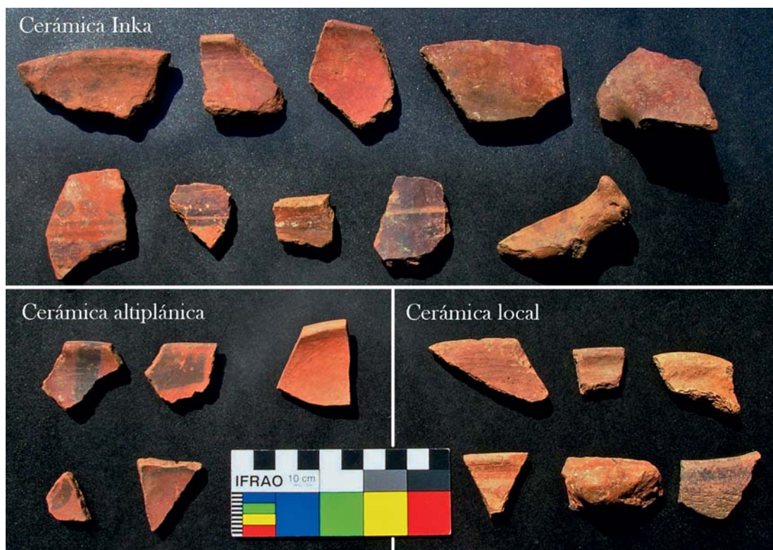
Figura 4. Material cerámico procedente de Camata incluyendo los estilos Inka, altiplánico (Negro sobre Rojo) y local. Ceramic material from Camata including the Inka, altiplano (Black on Red), and local styles.

D’Altroy (1992), a partir de sus investigaciones en el valle del río Mantaro en los Andes Centrales, ha planteado dos tipos de estrategias de control empleadas por los Inka. Por una parte, la estrategia territorial se caracteriza por la ocupación