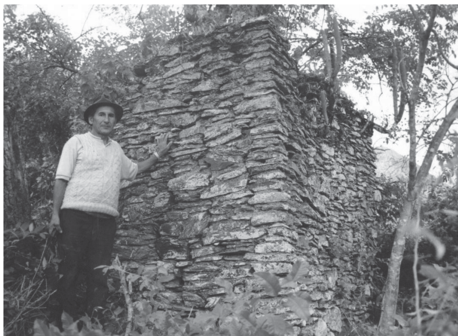
Figura 3. Estructura habitacional en Maukallajta. Parte del muro observado consiste de una terraza que nivela el piso de la estructura en el inclinado terreno.

Este sector está delimitado por un extenso muro de 350 m de extensión, que sigue levemente el nivel del terreno, con un espesor algo superior a un metro y una altura que en algunos casos es mayor a 2 m, elaborado por hiladas rústicas y aparejos irregulares de rocas de gran tamaño en algunos casos canteadas parcialmente, su orientación general es de este a oeste. El límite occidental del muro lo conforma la quebrada formada por la cascada actualmente conocida como Quiñuwaya (que conforma el límite oeste principal del sitio) y hacia el oriente toma rumbo norte, delimitando por el este al sitio.