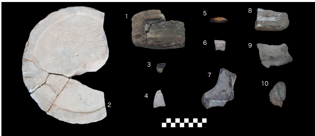
Figura 2. Cerámicas metalúrgicas sometidas a cortes petrográficos.

Metallurgical ceramics subjected to petrographic analysis.