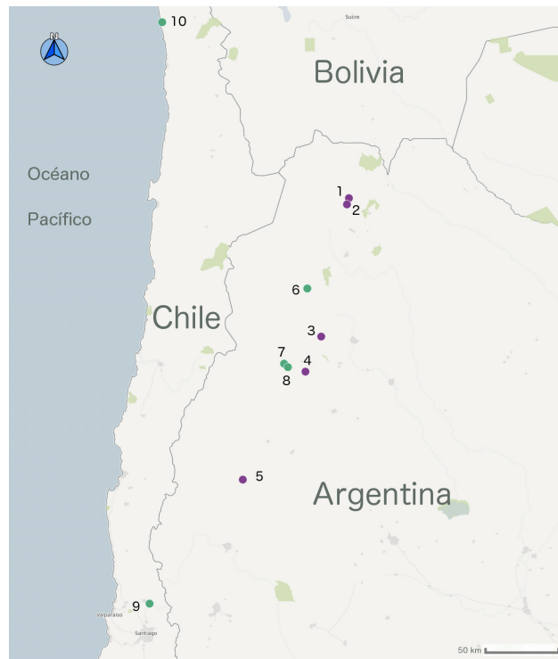
Figura 1. Mapa del Noroeste argentino, indicando procedencia de las muestras de estudio y de otros sitios mencionados con evidencia de cerámicas metalúrgicas en los Andes del Sur: 1. Huacalera, 2. Tilcara, 3. Rincón Chico, 4. Potrero-Chaquiago, 5. área de Jáchal; 6. Tacuil, 7. Campo de Carrizal, 8. Quillay, 9. Los Nogales, 10. valle de Camarones.

del Museo Etnográfico “Juan Bautista Ambrosetti” de Buenos Aires (colección Casanova, número catálogo 28293) y no hay precisiones acerca de sus condiciones de hallazgo. Se conocen pequeñas campanas dobladas y con badajo de este sitio, que fueron asignadas a inicios del periodo de Desarrollos Regionales (ca. 1100-1280 DC) (Gudemos 1998). El molde de disco del sitio conglomerado de Tilcara (M2), que abarca 9 hectáreas y cuenta con 500 unidades constructivas, se encontró dentro de la unidad habitacional 1, en el recinto 3.2, cuyas diversas estructuras estuvieron destinadas al trabajo artesanal y espacio habitacional (Tarragó y González 1998). Los diversos fechados contextualizan temporalmente a esta unidad desde mediados del periodo Tardío hasta fines del momento incaico (Otero y Ochoa 2011). Junto a este fragmento se registraron varios trozos de arcilla modelada pertenecientes a moldes de cera perdida, así como un fragmento de cobre nativo, una gota de cobre y cincel de cobre (Otero 2013).