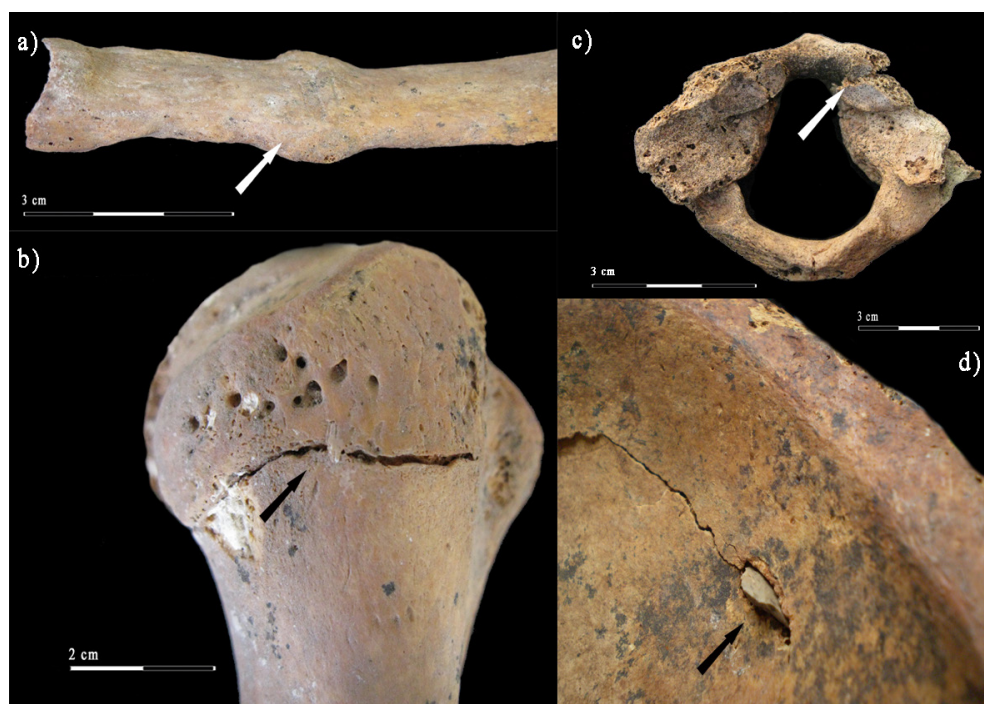
Figura 2. (a) Callo osificado en la costilla de un individuo masculino adulto medio del sitio Orejas de Burro; (b) fractura lineal en el sector latero-posterior del cuello de un húmero derecho perteneciente a un individuo masculino del sitio Orejas de Burro, con evidencia de remodelación ósea (flecha); (c) fractura del arco anterior del atlas de un individuo de sexo indeterminado del sitio Shamakush, con evidencia de remodelación; (d) punta de proyectil inserta en el ilion (flecha) de un individuo masculino procedente del norte de Tierra del Fuego, sin evidencia de remodelación ósea. Imágenes tomadas de Suby (2014) y Suby y Guichón (2010).

(a) Ossified callus in the rib of a middle adult male individual from the Orejas de Burro site; (b) linear fracture in the lateral-posterior neck of a right humerus belonging to a male individual from the Orejas de Burro site, with evidence of bone remodeling (arrow); (c) fracture of the anterior arch of the atlas with evidence of bone remodeling in an individual of undetermined sex from the Shamakush site; (d) projectile point inserted in the ilium (arrow), without evidence of bone remodeling in a male individual from the North of Tierra del Fuego. Images taken from Suby (2014) and Suby and Guichón (2011).