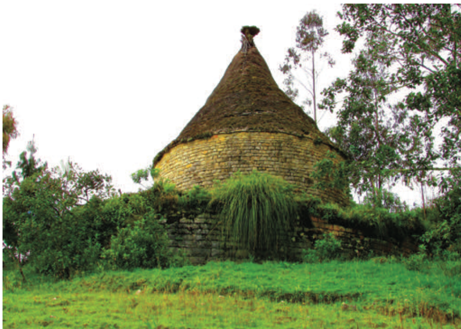
Figura 12. Superposición de muros en el sitio de Yurac-Urco. Wall overlapping at the Yurac-Urco site.

Está conformado por estructuras arquitectónicas a ambos lados del camino proveniente de Collacruz. Se visualizan muros de piedra utilizados para contención y