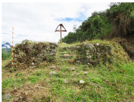
Figura 6. Vista frontal de la estructura arquitectónica de Cruz de Pongomal.

El segundo camino registrado fue la sección de camino que parte del actual Levanto hacia el sitio