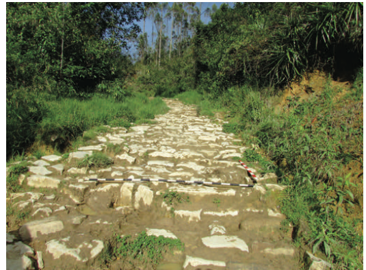
Figura 7. Sección empedrada con peldaños. Camino a Yálape. Cobbled stepped section. Road to Yálape.

La sección del camino en mención corresponde a un empedrado, por lo general cuesta arriba, combinada con pendientes laterales en zigzag, con drenajes de buena manufactura, debido a que la zona es propensa a