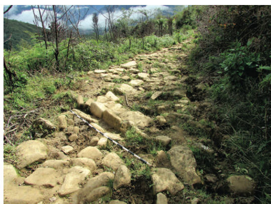
Figura 5. Canal de drenaje, tipo abierto.

Zigzag sections of the Levanto - Chachapoyas road.