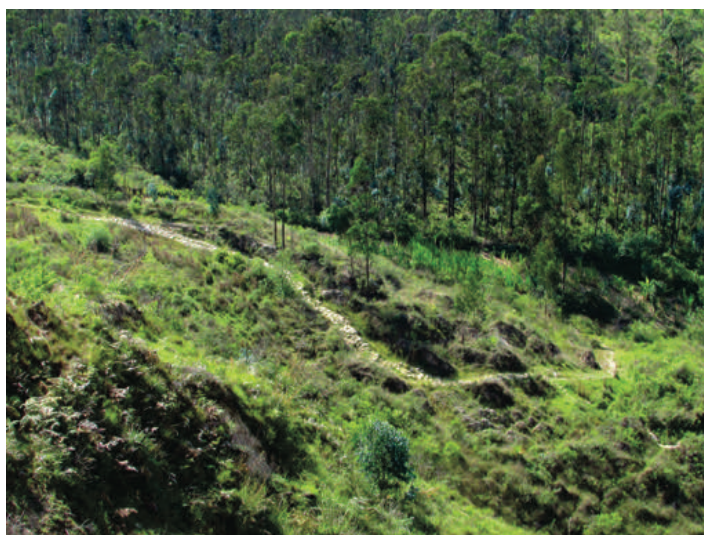
Figura 4. Desplazamiento en zigzag del camino Levanto - Chachapoyas.

Zigzag sections of the Levanto - Chachapoyas road.