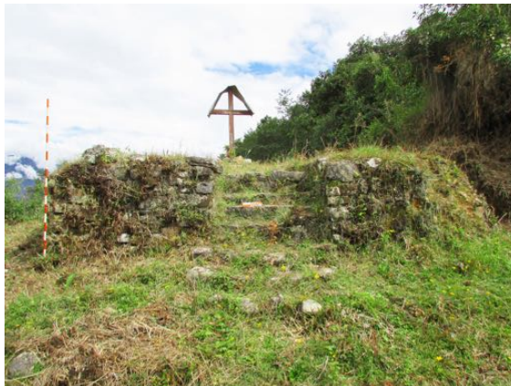
Figura 6. Vista frontal de la estructura arquitectónica de Cruz de Pongomal. Front view of the Cruz de Pongomal architectural structure.

El segundo camino registrado fue la sección de camino que parte del actual Levanto hacia el sitio