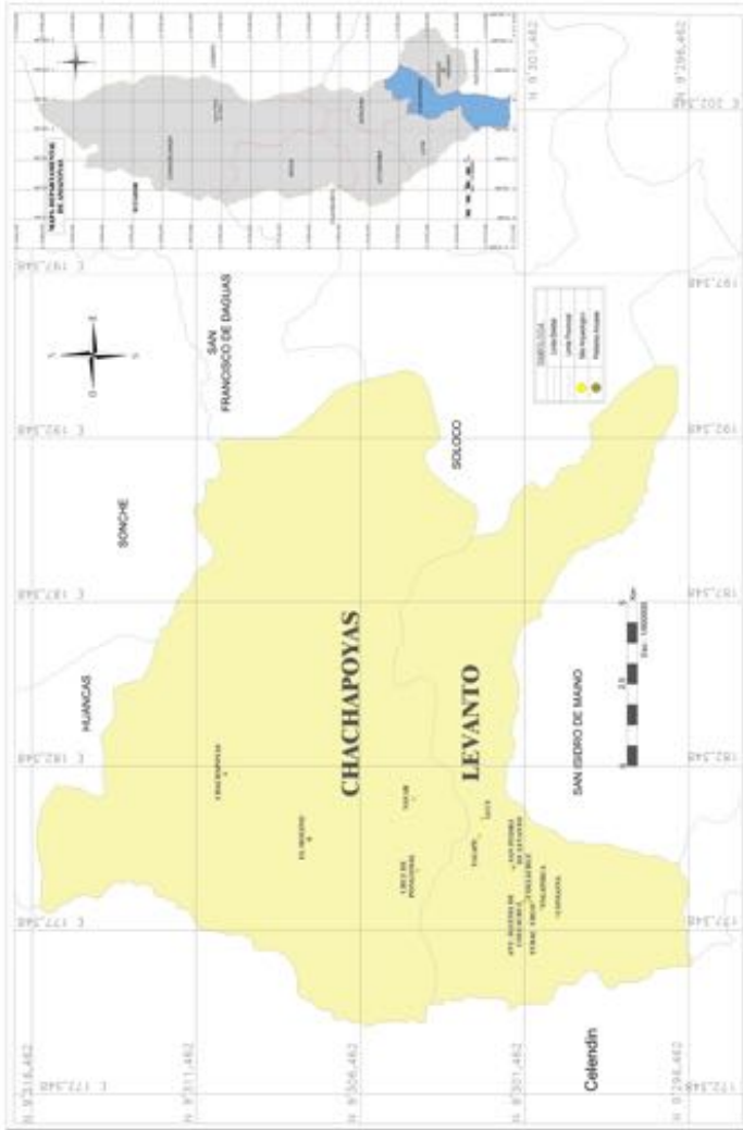
Figura 1. Plano de ubicación con los sitios arqueológicos y poblados actuales mencionados en este texto. Location map with the archaeological sites and towns mentioned in the text.