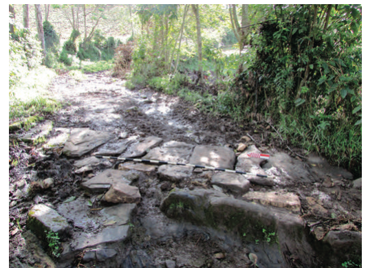
Figura 8. Canal de drenaje, tipo cerrado. Close type drainage channel.

precipitaciones durante casi todo el año. En esta sección sobresale, además, un afloramiento rocoso que ha sido parcialmente cavado para generar peldaños, bastante similar al registrado por Koschmieder en la provincia de Luya, departamento de Amazonas (Koschmieder 2012:79).