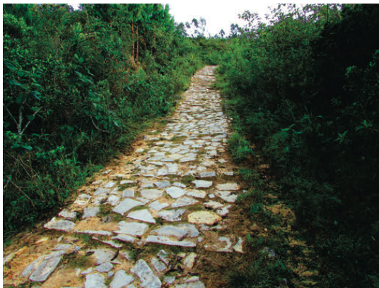
Figura 3. Sección empedrada de camino Levanto - Chachapoyas. Cobbled section of the Levanto - Chachapoyas road.

Map with the layout of the pre-Hispanic roads and the location of the archaeological sites in the study area.