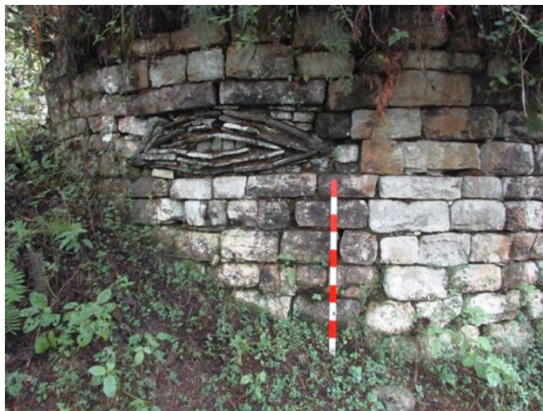
Figura 9. Recinto circular, detalle de arte mural chachapoyas en Yálape.

pequeñas pudieron cumplir una función funeraria, por el hallazgo superficial de material óseo humano y cerámica fragmentada; estas probables estructuras funerarias se hallan en un nivel inferior a las estructuras circulares, anteriormente descritas. Por último, el Sector 3,