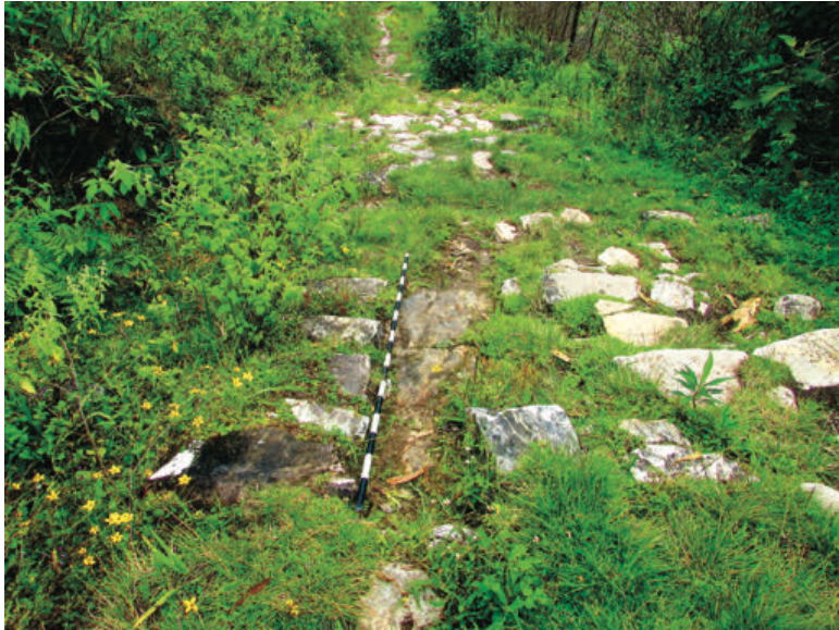
Figura 10. Sección empedrada de camino Levanto- Collacruz.

Cobbled section of the Levanto - Collacruz road.