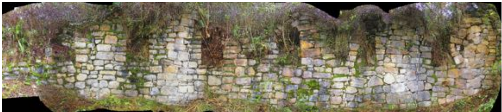
Figura 14. Detalle del muro con hornacinas trapezoidales en el sitio de Congona.

Detail of the inka curved wall of Yurac - Urco.