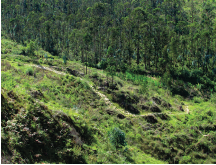
Figura 4. Desplazamiento en zigzag del camino Levanto - Chachapoyas. Zigzag sections of the Levanto - Chachapoyas road.