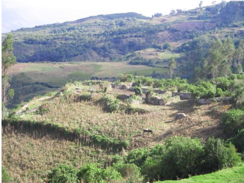
Figura 11. Vista panorámica del sitio arqueológico de Collacruz.

Cobbled section of the Levanto - Collacruz road.