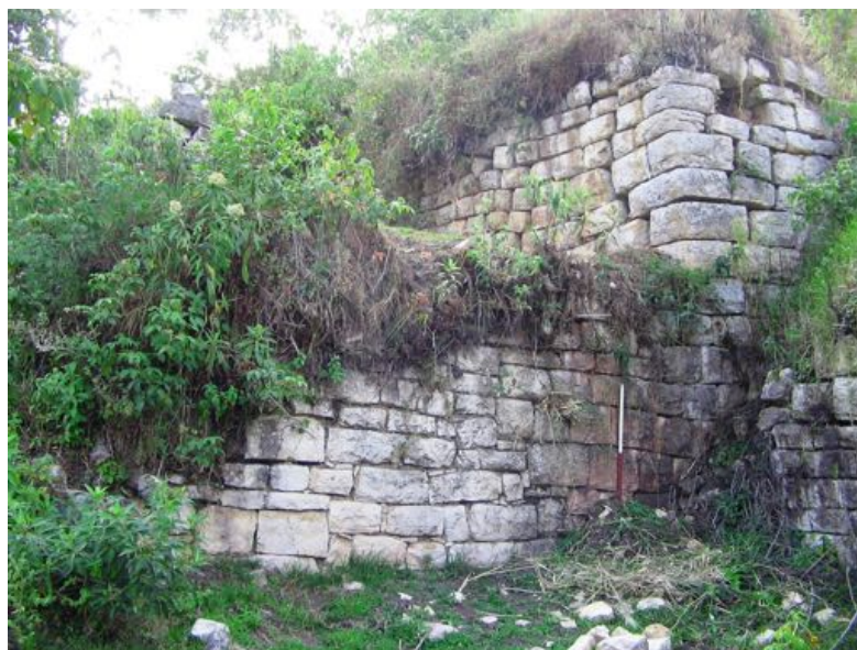
Figura 15. Sección de muros rectos de planta rectangular en Ingapirka.

Section of straight walls of rectangular plan in Ingapirka.