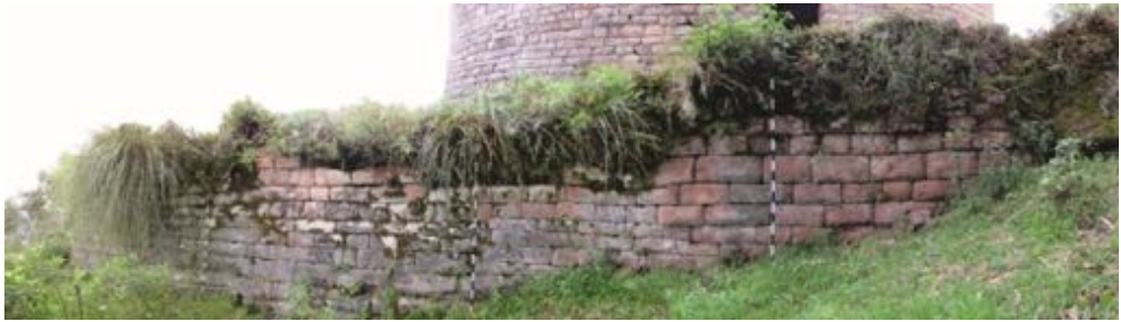
Figura 13. Detalle del muro curvo inka de Yurac - Urco.

Detail of the inka curved wall of Yurac - Urco.