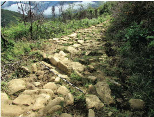
Figura 5. Canal de drenaje, tipo abierto. Open type drainage channel.

alrededor de una gran roca natural localizada al centro de la estructura. La estructura presenta en su fachada siete escalinatas de piedra, siendo la orientación de esta fachada de este a oeste (Figura 6). En la actualidad, en la cima de esta plataforma se reconoce una cruz de madera la que nos puede indicar no solo la función actual de la estructura como un altar católico, sino también deducir su uso en tiempos pretéritos por la arquitectura descrita. Nuestra propuesta funcional, por sus características arquitectónicas y emplazamiento, es que se trataría de un ushnu en el cruce de caminos.