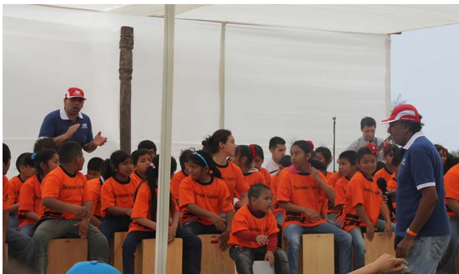
Figura 14. Talleres de expresiones artísticas con el patrimonio. Workshops of artistic expressions with the heritage.

otorgan la escuela, las instituciones, los profesionales responsables de la conservación y puesta en valor del sitio, con los significados que el público escolar tiene (Figura 14). A partir de ese encuentro se busca construir juntos nuevos significados, y encontrar sentido a la preservación y respeto al patrimonio que lo rodea, haciendo suyos los valores que representa (Figura 15).