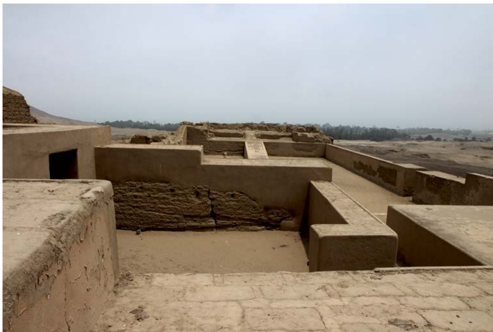
Figura 2. Pirámide con rampa 2 - Pachacamac.

Pyramid with ramp 2 - Pachacamac.