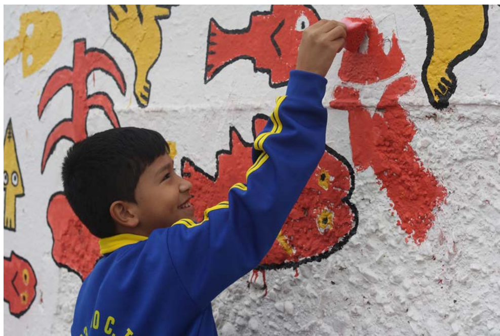
Figura 8. Trabajos con los AAHH del entorno del sitio arqueológico.

Work with the AAHH of the the surroundings of the archaeological site.