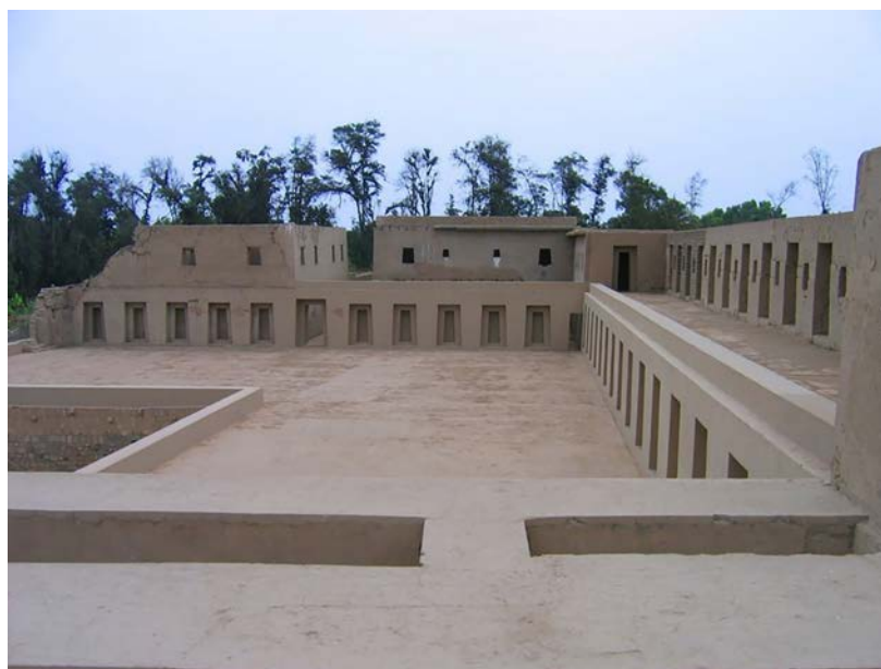
Figura 15. El reto es encontrar juntos el sentido de preservación y respeto al patrimonio que nos rodea.

The challenge is to find together the sense of preservation and respect for the heritage that surrounds us.