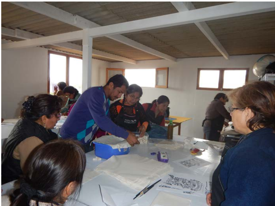
Figura 9. Programa de Desarrollo Comunitario. Community Development Program.

Este grupo ha podido constituirse en Asociación Civil sin fines de lucro, SISAN que significa -florecer en quechua. Representa a una organización de mujeres emprendedoras, que generan ingresos que les permite tener un pequeño fondo a fin de mes a cada una de ellas y contribuyen a la mejora de la economía de sus hogares y por consiguiente a sus condiciones de vida.