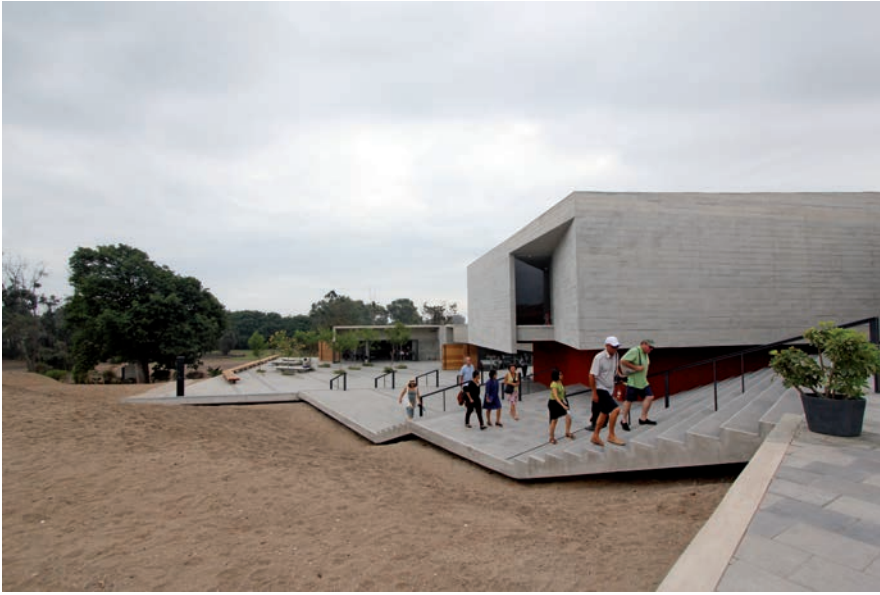
Figura 3. Fachada del nuevo Museo de sitio. Archivo Museo de sitio Pachacamac. New site Museum. Pachacamac Site Museum Archive.