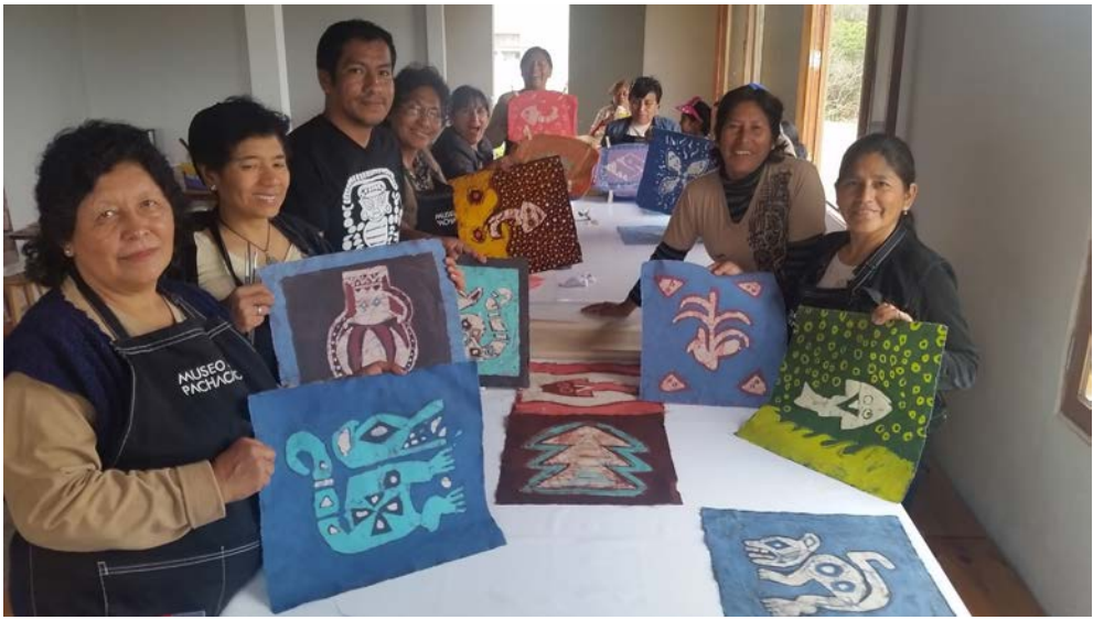
Figura 11. Taller de teñido en reserva. Archivo Museo de sitio Pachacamac.

Dyeing in reserve Workshop. Pachacamac Site Museum Archive.