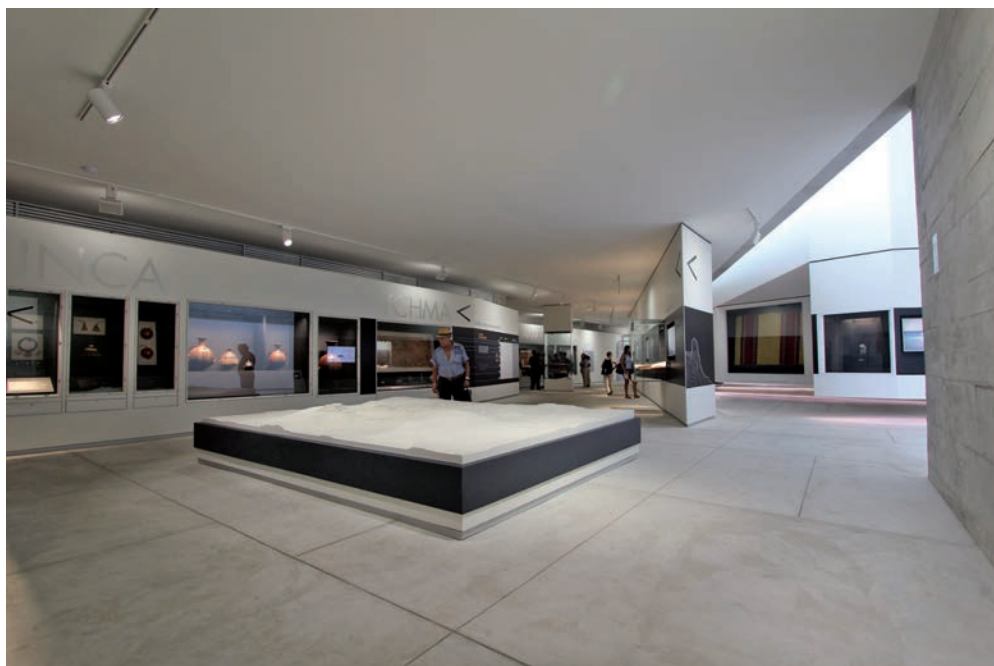
Figura 7. Vista interior del Museo Pachacamac.