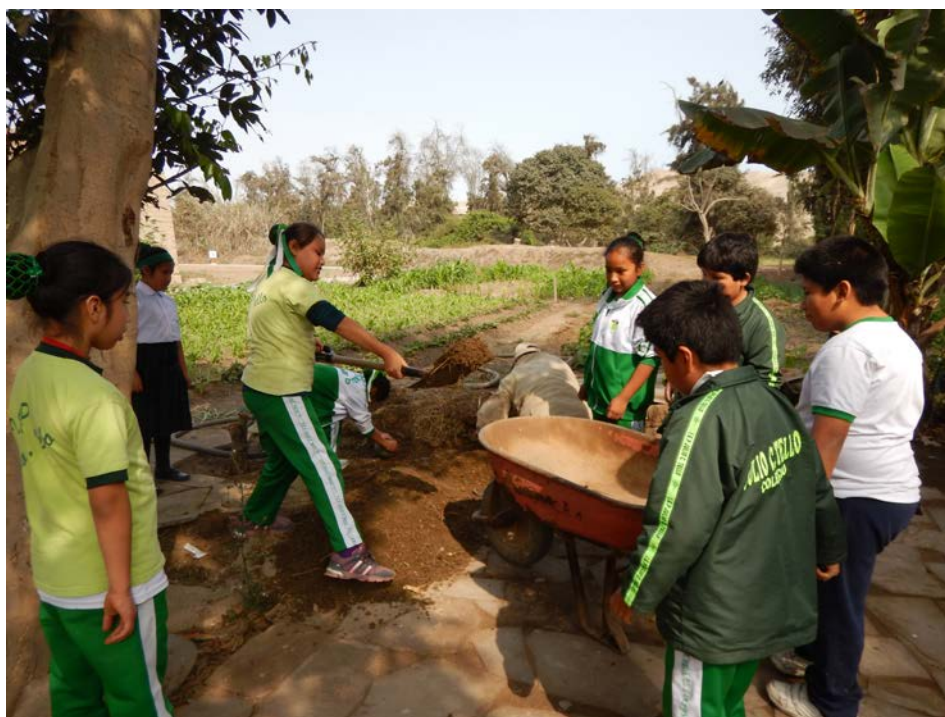
Figura 12. Programa Educativo.

Educational Program.