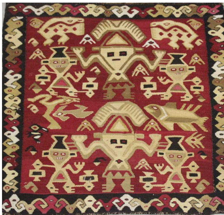
Figura 6. Paño en tapiz Ychma. Registro Nacional N°89815.

Cloth in Ychma tapestry. National Record N°89815.