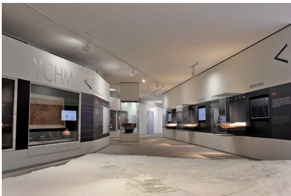
Figura 5. Vista interior del Museo.

El MSPAC no es ajeno a estos problemas. Estamos trabajando para que de alguna manera estos conflictos políticos no enfrenten a los pobladores, y por ello ha sido importante la participación de la población de estos distritos en nuestras diferentes actividades para lograr una identificación con el sitio que van más allá de los límites distritales. El sitio arqueológico y el museo