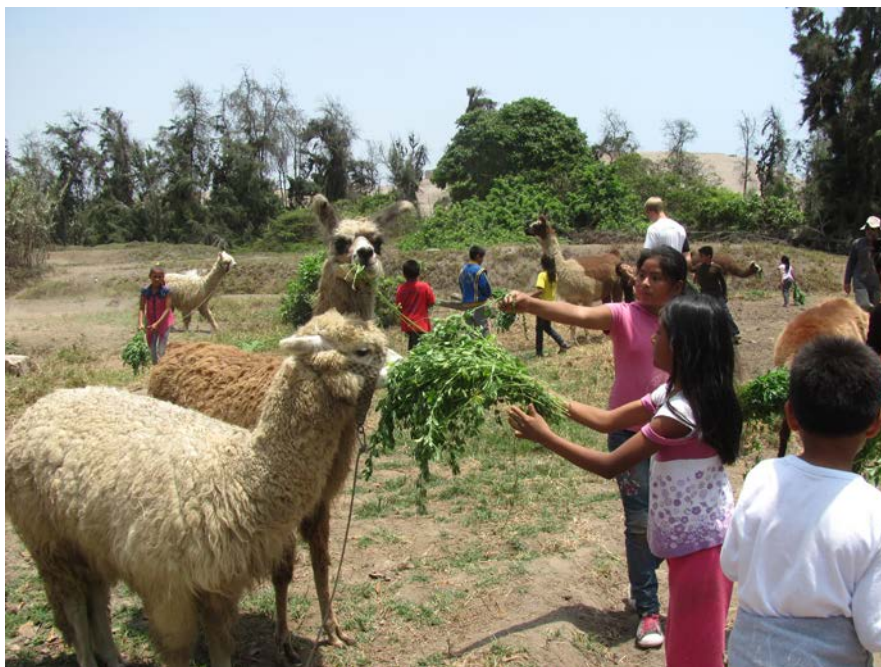
Figura 13. Visitas guiadas a niños. Guided tours for children.

aves de perfil, peces en movimiento, plantas y personajes en las graderías, testimonio de la iconografía de la época.