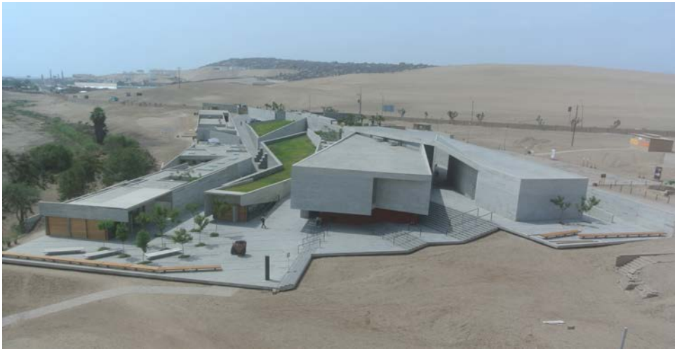
Figura 4. Edificio del nuevo Museo de sitio. Archivo Museo de sitio Pachacamac. Building of new New site Museum. Pachacamac Site Museum Archive.