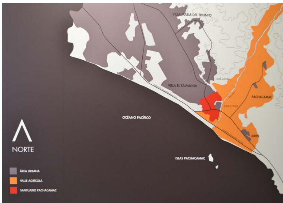
Figura 1. Plano de ubicación del santuario de Pachacamac.

Location Map of the Pachacamac sanctuary.