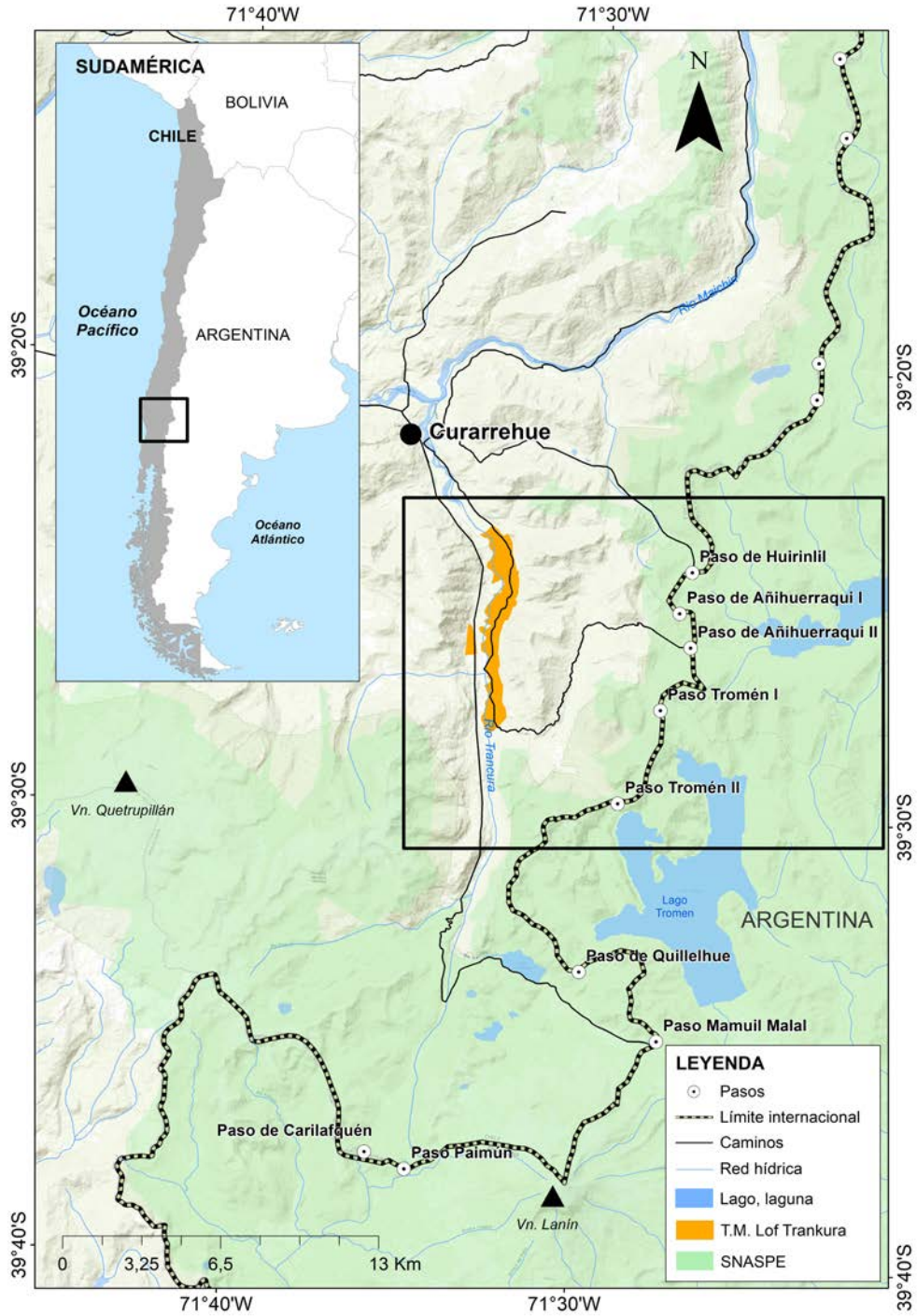
Figura 1. Lof Trankura. Localización aproximada. Elaboración propia.

Lof Trankura. Approximate location. Map credit: author.