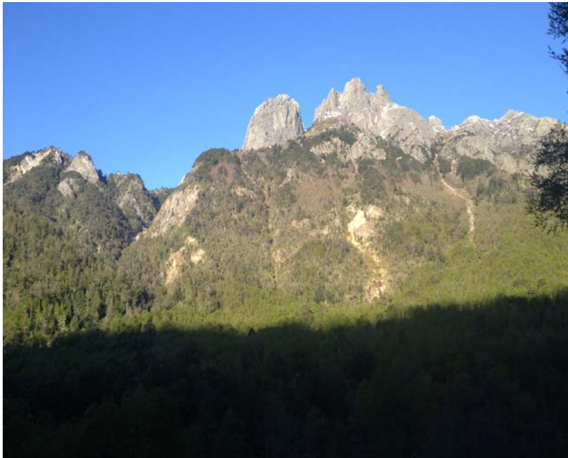
Figura 6. Cima cerro Millallifén.

A partir del caso del Lof Trankura, se identificaron tres niveles de análisis en relación a las narrativas de la movilidad y que gravitan en el sentido de pertenencia social del pueblo mapuche con sus