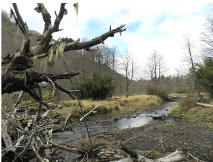
Figura 4. Valle del río Momolluco.

Momolluco River Valley.