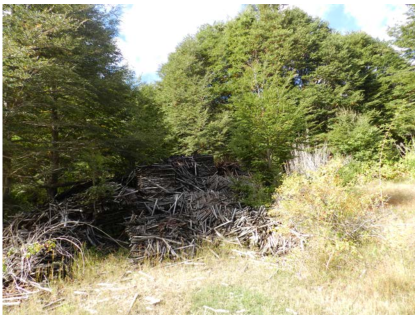
Figura 5. Parque Nacional Villarica, sector Añihuerraqui.

Villarica National Park, Añihuerraqui sector.