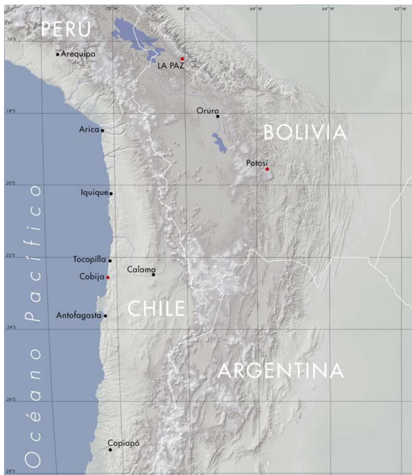
Figura 3. Mapa actual de la zona de estudio. Current map of area of study.

Existe un primer momento, desde 1825 a 1840, desde la independencia de Bolivia hasta el inicio de la intensificación de la explotación del guano en Atacama. Durante este periodo, la necesidad de incentivar la minería en Potosí impulsó la construcción de rutas de comunicación, con el objeto de activar el tráfico arriero y la circulación desde el interior de la República hasta la costa. En esta escena, destaca la puesta en marcha del camino que unió la costa de Lamar con la ciudad de Potosí (Borie et al. 2016; Cajías 1975). Para la implementación del Puerto Lamar en 1827 se dictaron una serie de medidas cuyo objetivo principal