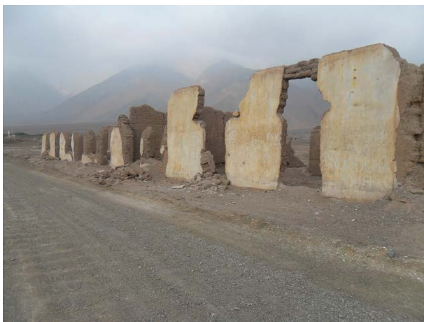
Figura 1. Ruinas actuales del Puerto Lamar.