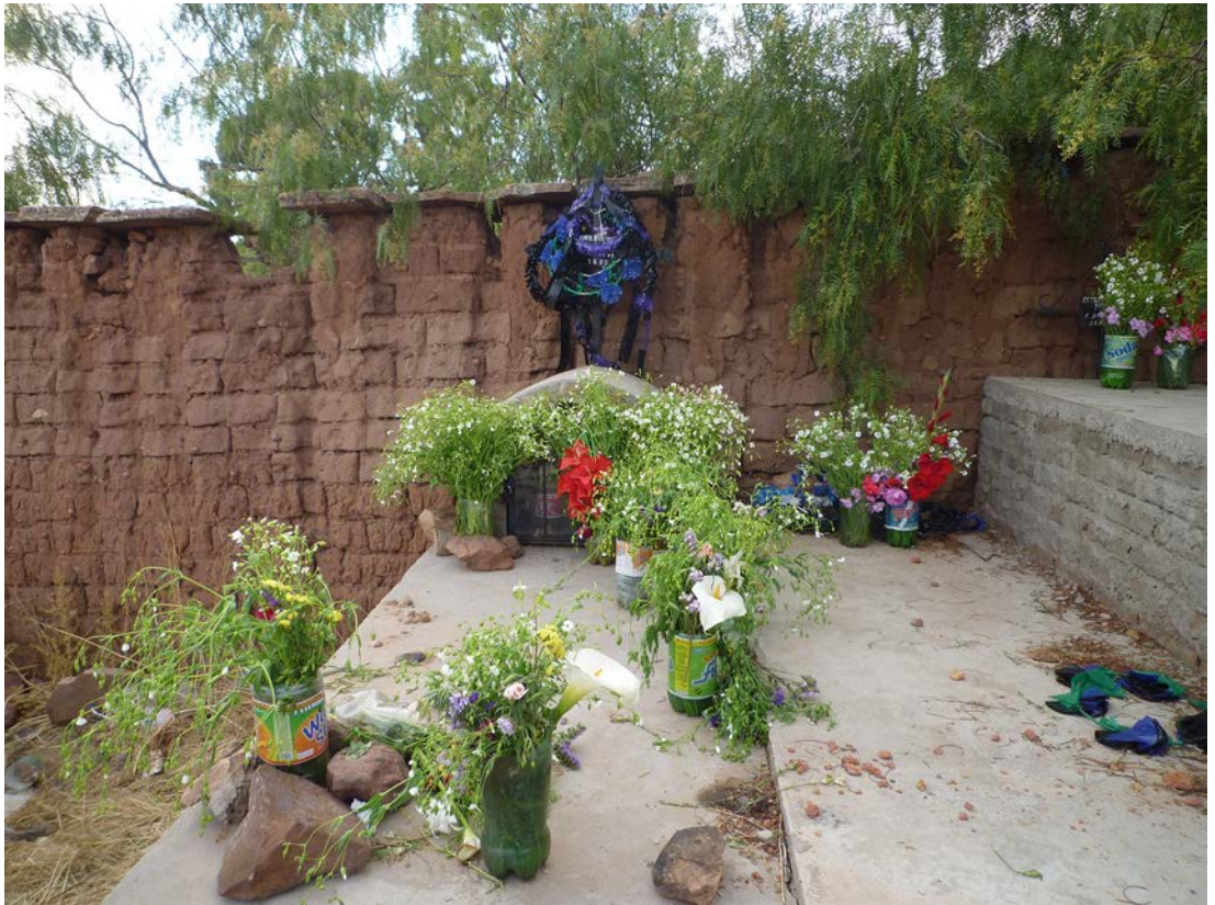
Figura 3. Una tumba decorada con flores modestas. A tomb decorated with modest flowers.

realmente complicado de gestionar y el ambiente era diametralmente opuesto al del día anterior en la celebración evangélica. Excepto las mujeres jóvenes y los niños, el resto se encontraba en estado de gran embriaguez. Había discusiones y conatos de pelea. Las mujeres mayores, ebrias, se abalanzaron sobre mí con la intención de que bebiera de las muchas botellas con alcohol que circulaban. Los pocos hombres que se encontraban más o menos sobrios me invitaron a sentarme junto al viudo y el padre de la difunta, a un costado del altar. Este ocupaba el lugar central del patio y aunque resulta complicado pensar que allí existiera un cierto orden, sí es cierto que a un costado del altar se encontraban los familiares directos de la difunta, al otro los hombres adultos; y en cierta forma, retiradas y cercanas a la puerta de salida, las mujeres jóvenes y los niños.