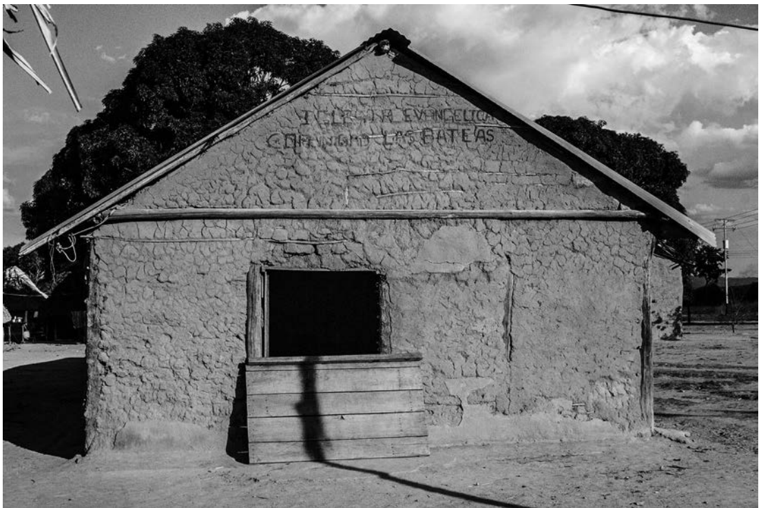
Figura 2. Iglesia evangélica de La Batea. Evangelical Church of La Batea.

En cambio, en medio del pueblo se erigía una pequeña choza de bahareque en cuya puerta estaban inscritas en castellano las palabras “Iglesia Evangélica Comunidad Las Bateas” 12 . (Figura 2). En el interior de esta casa se veían algunos bancos y en el fondo una suerte de podio donde relucía un piano eléctrico y una guitarra eléctrica tipo Fender. Sin embargo, en las sucesivas estadías en La Batea fue haciéndose evidente que algunos elementos que inicialmente interpretaba como consecuencias de la evangelización, eran en realidad parte del carácter cultural de los Eñepá.