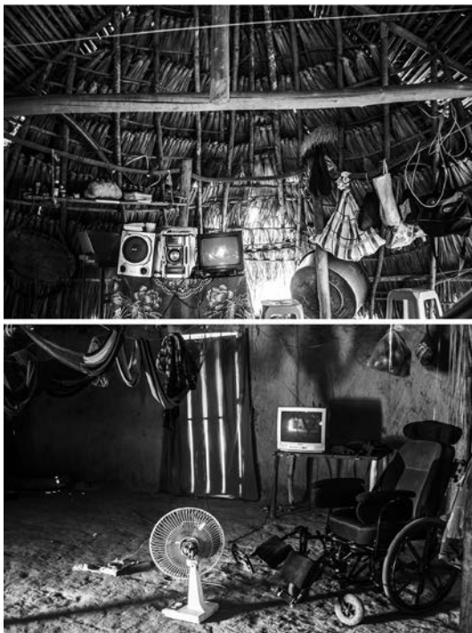
Figura 5. Mundos “moderno” y “tradicional” en convivencia.

El punto central de esta investigación consistió en averiguar si esta forma multinaturalista y perspectivista coexiste con la creencia cristiana. Efectivamente, es posible ver cómo la relación con los espacios de la naturaleza, los animales y dominios externos a los territorios Eñepá demuestran que aún existe una relación multinaturalista con el reino natural y espiritual, en la medida en que los animales y las plantas poseen “dueños” con quienes hay que “negociar” para interactuar con ellos. Y así, el Dios cristiano y el concepto de la Trinidad, que desplazaron en cierta medida la imagen de Mareaoka y los mitos de creación ancestrales, funcionan como categorías que conciernen sobre todo el mundo moral, pero no el natural o no humano, donde aún rige la ontología antigua. Del mismo modo, el desarrollo del mismo individuo y la relación con su comunidad tampoco desaparece en la medida en que persisten costumbres como la manera de clasificar al ser humano según diversas etapas vitales (desde la lactancia hasta la adultez). Por último, destacamos que muchos de sus conocimientos y prácticas nunca dejaron de existir en el seno de la intimidad, pero fueron ocultados y guardados con recelo ante la cara del criollo o extranjero para protegerlos de ulteriores proscripciones o críticas.