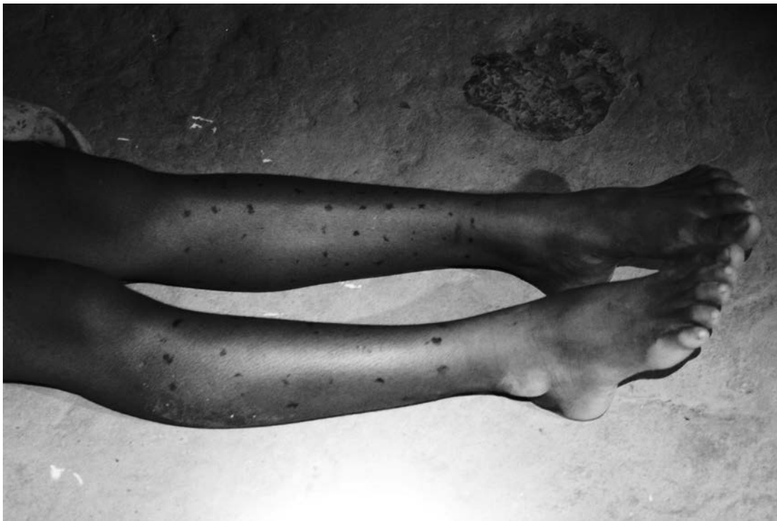
Figura 3. Niña de 12 años (2015) muestra sus piernas pintadas con karaña. 12-year-old girl (2015) shows her legs painted with karaña.

de las casas secan la semilla de onoto, aunque explican que solo lo usan para teñir los guayucos y las telas de las hamacas.