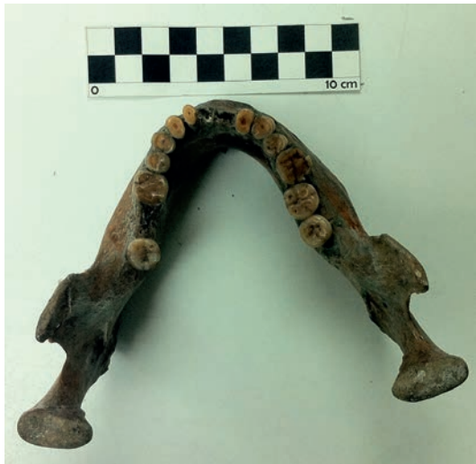
Figura 5. Desgaste de las piezas dentales inferiores del Individuo 1. Wear of the lower teeth of Individual 1.