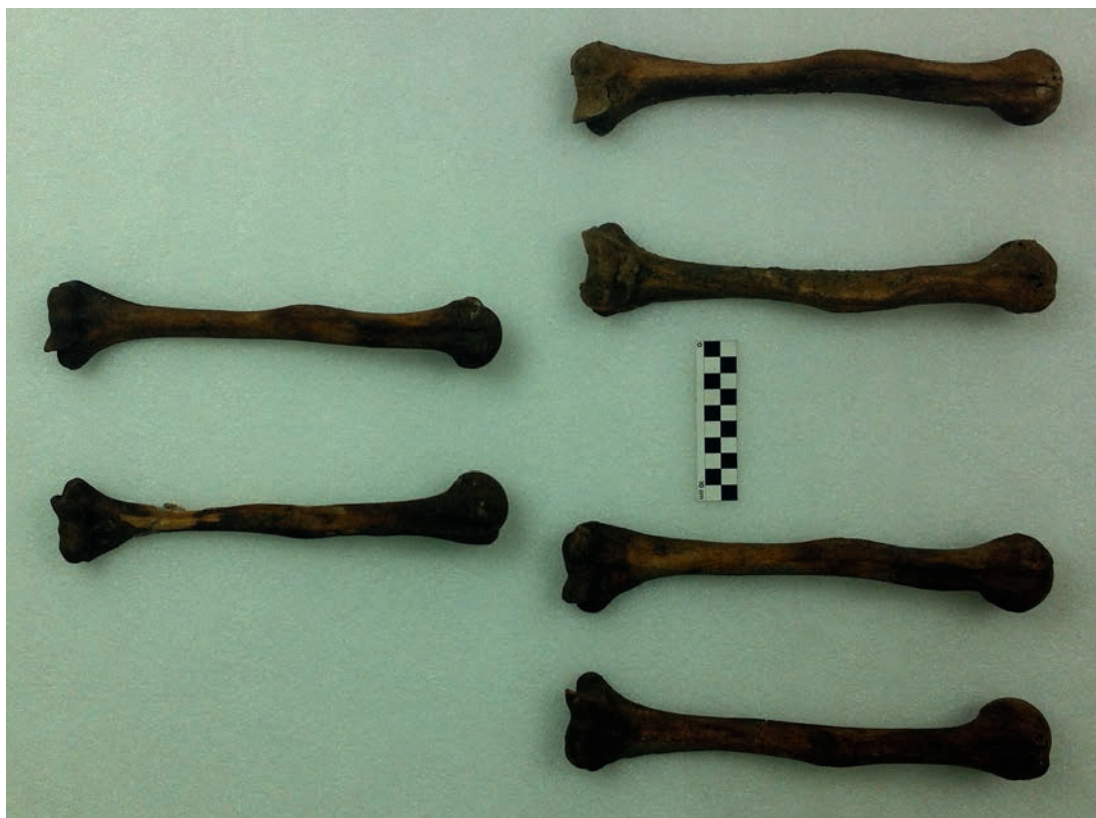
Figura 7. Retroversión humeral en miembros superiores de los Individuos 1 y 2 (derecha) y ausencia del rasgo en el miembro superior del Individuo 3 (izquierda).

Humeral retroversion in upper limbs of Individuals 1 and 2 (right) and absence of the feature in the upper limb of Individual 3 (left).