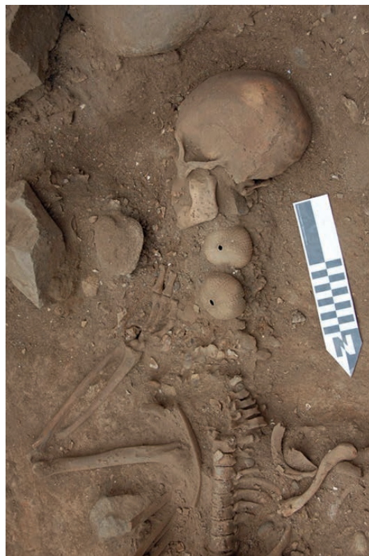
Figura 4. Detalle de las conchas de erizos ubicadas en la región cervical del Individuo 1.

Details of sea urchin shells located in the cervical region of Individual 1.