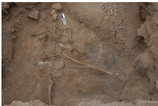
Figura 3. Vista general del contexto funerario del Individuo 1. General view of the funerary context of Individual 1.

El individuo 4 se encontró desarticulado y depositado entre las piernas del individuo 1. Estas evidencias conducen a la hipótesis de que correspondería a un entierro secundario. Finalmente los individuos 2 y 3 se registraron en la capa 6 y corresponden a entierros secundarios, desarticulados