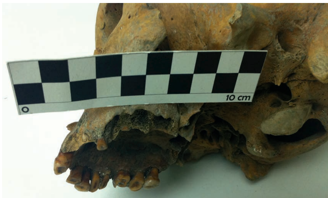
Figura 6. Abscesos observados en el maxilar del Individuo 2. Abscesses observed in the maxilla of Individual 2.