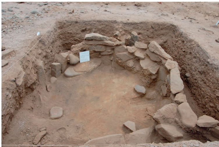
Figura 2. Estructura subcircular de piedra descubierta en el sitio arqueológico Copaca 1. Subcircular stone structure discovered in the archaeological site Copaca 1.

Los cuatro individuos fueron encontrados al interior de la estructura mencionada. Dos de ellos (Individuos 1 y 4), encontrados en la capa 5, fueron dispuestos sobre un piso sello, a diferencia de lo que se ha planteado para el sitio Caleta Huelén