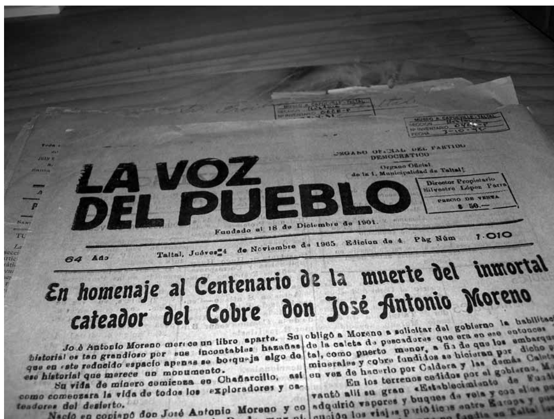
Figura 4. Periódico La Voz del Pueblo, Taltal. 1965. Newspaper La Voz del Pueblo, Taltal. 1965.

uno de ellos hornos de fundición (Archivo Claudio Gay, 1854-1860: vol. 42, foja 159).