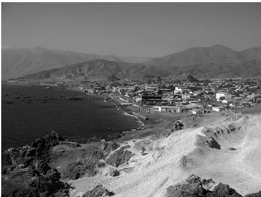
Figura 2. Bahía de Taltal. Bay of Taltal.

preferido sobre el hierro por su resistencia y durabilidad (Matte 1981:58).