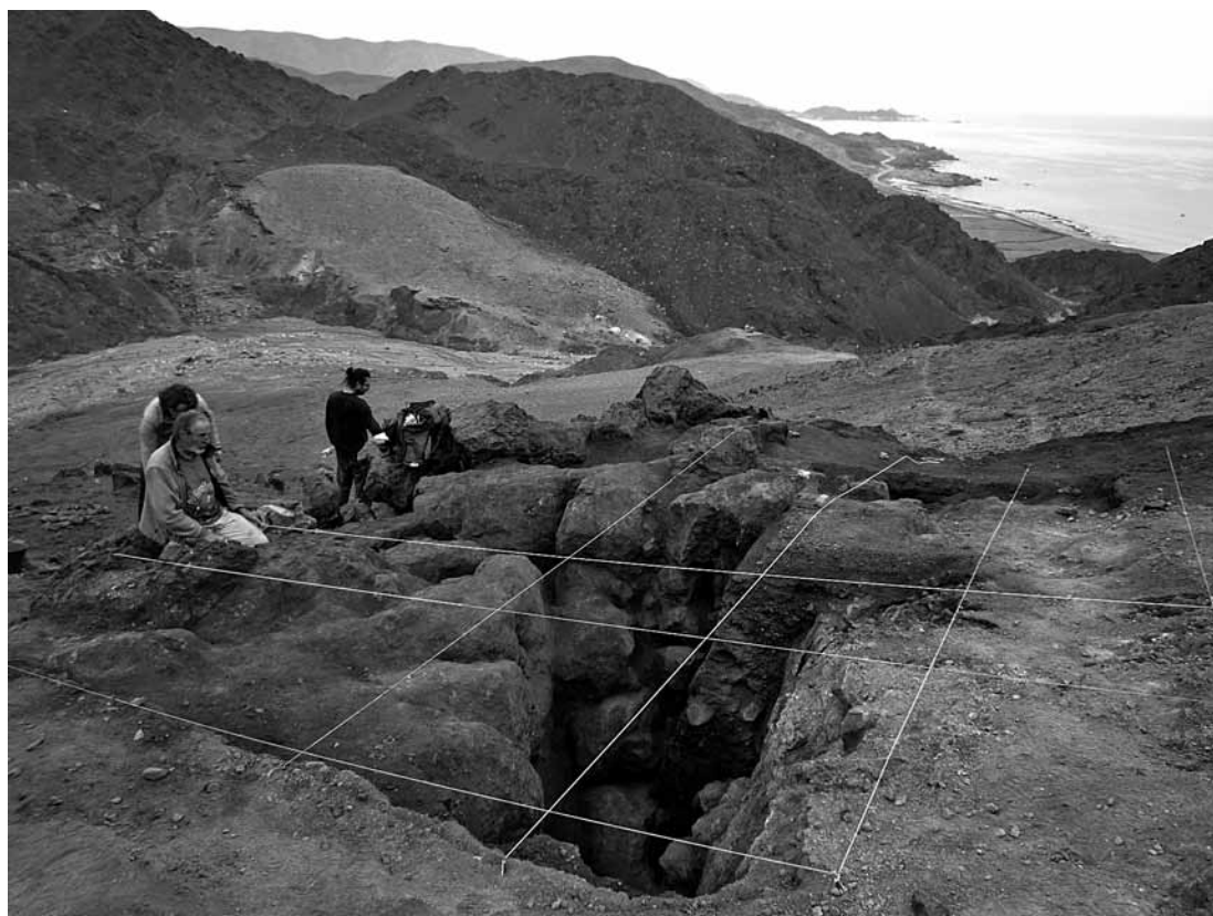
Figura 3. Mina San Ramón. San Ramón mine.

campesinos que se convirtieron a la minería, así como inversionistas extranjeros.